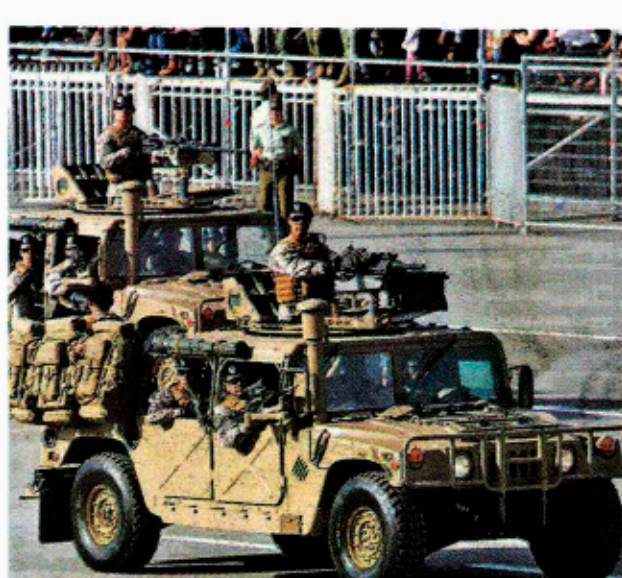
►► Parte de los 26 Humvee blindados del Ejército.