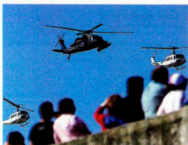
►► El helicóptero Black Hawk de la Fuerza Aérea durante la exhibición.