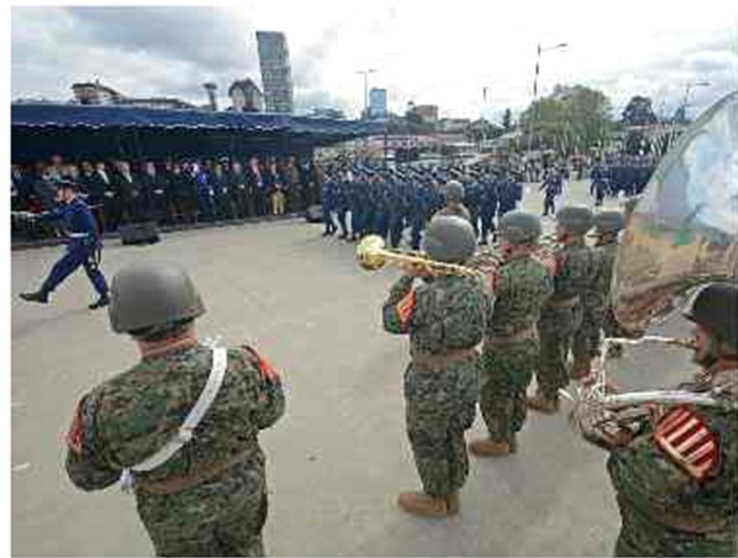
El desfile que siguió al acto principal (C. Brown).