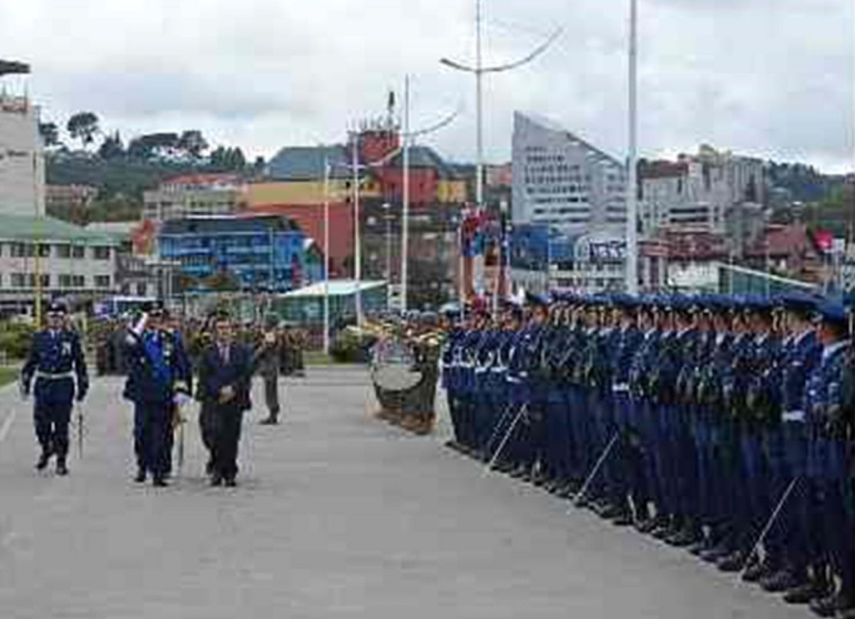
La ceremonia fue en el Campo de Marte (C. Brown).