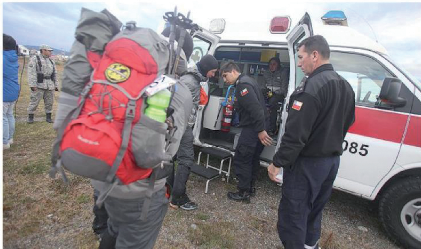
La Fuerza Aérea de Chile prestó apoyo mediante una evacuación aeromédica