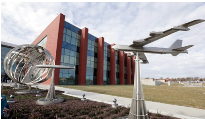
El edificio de C2F, nuevas instalaciones de comando y control del STRATCOM, en la base aérea Offutt, Nebraska

De hecho, aunque el GIOCC estaba inicialmente dotado de personal proveniente del STRATCOM, ahora se ampliará en sus instalaciones de la base USAF en Offutt, Nebraska, e incorporará diverso nuevo personal con experiencia en mando de combate.